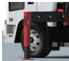
OUTRIGGER BOX TYPE