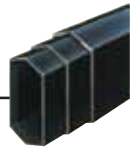
บูม 6 เหลี่ยม